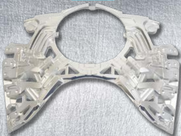
74А Механизм нагрудника